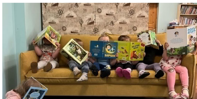
Antsla-Inno AS kingitud mugaval diivanil on lust raamatuid vaadata ja lihtsalt puhata.

Louise Hay on öelnud, et siiras „aitäh“ on võlupeegel, mis peegeldab meie sees ja maailmas peituvat ilu ja headust.