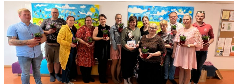
Koolitusel osalejad ja juhendajad.

Vanemlusharidusele suunatud koolitused on Eestis laiemalt levinud suuremates linnades. Positiivne on, et Antsla vald on alates 2017.aastast regulaarselt pakkunud koolitust. Tänavu jaanuaris asus grupp lapsevanemaid Lusti lasteaia koos õppima. Koos käidi 16 nädalat, igal nädalal oli vaatluse all erinev oskus või põhimõte: näiteks, kuidas lapsega mängimise, tema juhendamise ning tunnustamise kaudu suurendada lapse positiivseid käitumisi-