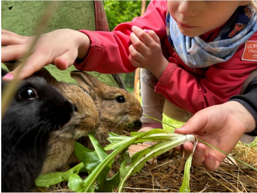
Pokumaale saabus mai keskel 20 jänkut, kes hakkavad elama iga jänes unistus-teelu - on suur jäneseloss, palju mahlast heina, vahvad sõbrad ja kõige olulisem, et rebased vahivad tara taga, suu sülge jooksmas. Kuldre kooli ja lasteaia lapsed said jänkudega sõbraks ja lusti jätkuks kohe kauemaks.

Pokukojas pannakse koostöös Eesti Lastekirjanduse Keskusega üles näitus „Mükoloogia ehk seente salajane elu“ ning lisaks valmib Po-