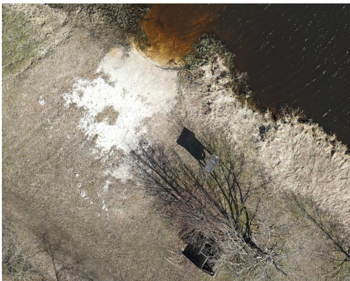
Joonis 1.2. Suplusala Nässmõisa paisjärve ääres (Taristu Grupp OÜ, 2022).