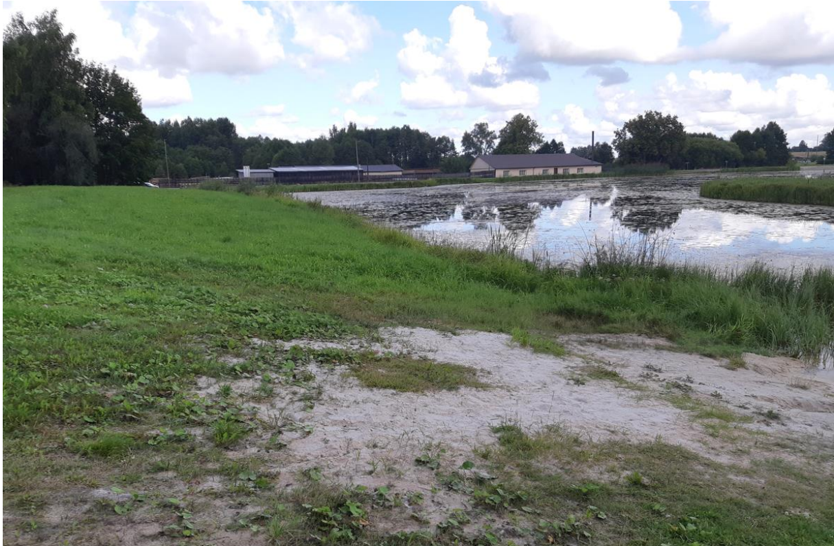
Joonis 1.3. Suplusala Nässmõisa paisjärve ääres, vaatega loodesse.

Järve ületavad kahes kohas elektriõhuliinid 1-20 kV (keskpingeliin). Elektripaigaldise kaitsevööndis keelatud tegevusi on käsitletud Ehitusseadustiku § 77. Järve ümbruses on ka maaparandust (vt joonis 1.4):