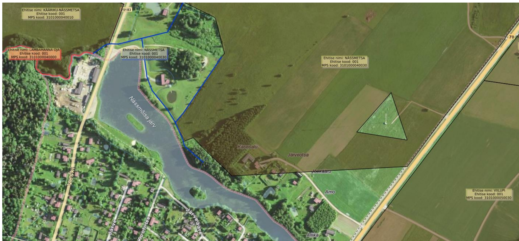
Joonis 1.4. Maaparandusobjektid Nääsmõisa paisjärve ümbruses (Maa-amet, 2022).