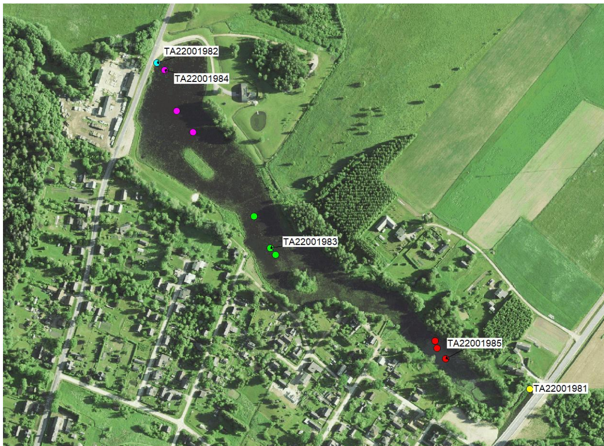
Joonis 1.6. Järve vee- ja setteproovide asupaigad.