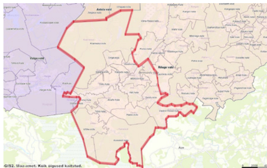
Antsla vallaga ühineda sooviv piirkond Antsla vallaga ühineda sooviv piirkond.

Omavalitsuste rahastamise küsimuste arutamiseks korraldasime koostöös Regionaal- ja Põllumajandusministeeriumi esindajatega. Täiendavalt koostame Mõniste piirkonna prognoositava eelarve, et välja selgitada selle piirkonna tulud ja kulud, nii palju kui see võimalik on. Kõiki kulusid ei arvestata piirkonnapõhiselt, st osa kulusid võtame arvesse meie oma valla praktikast