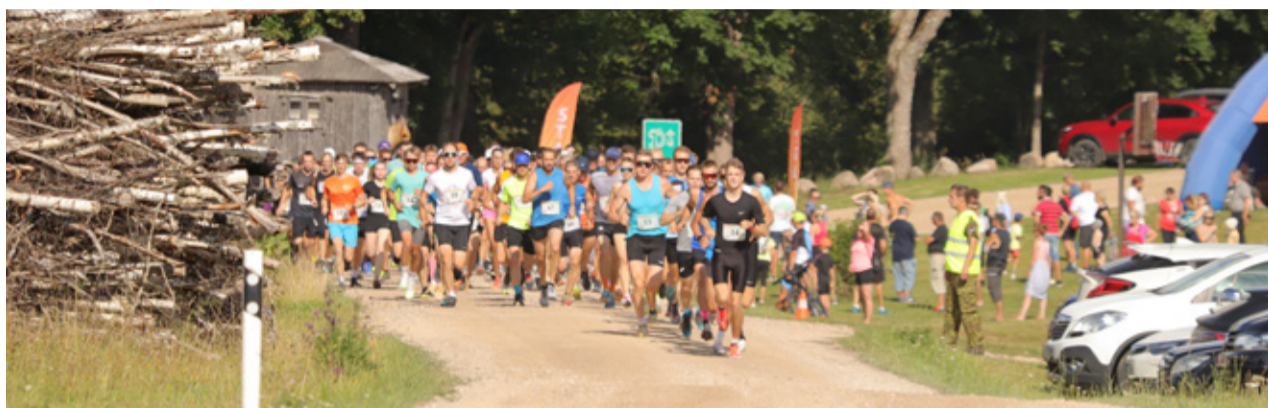
Ümber Uhtjärve jooksu põhidistantsi start.