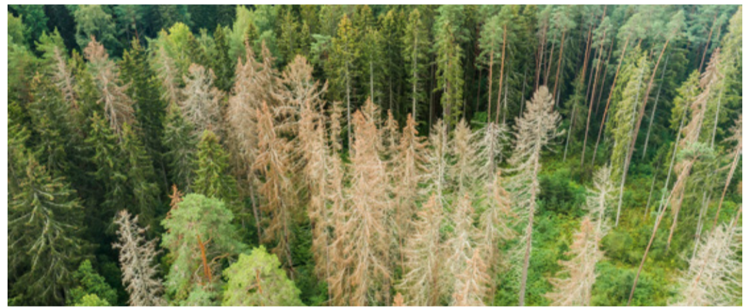
Ürasikahjustusega kuivanud kuused Kasumetsas.

Kasumetsa kava saab lugeda siin: https://media.rmk.ee/files/Antsla_linna_puhkemetsa_kava_aastateks_2023_2032.pdf .