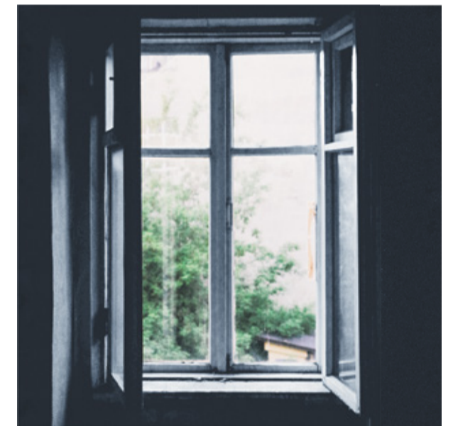
Sündmusest toimub veebiülekanne